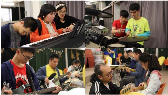
視多障孩子學習樂器