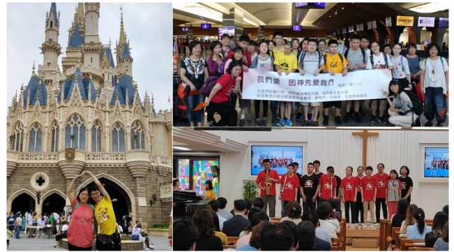
小西羅亞合唱團公開演出與戶外教學