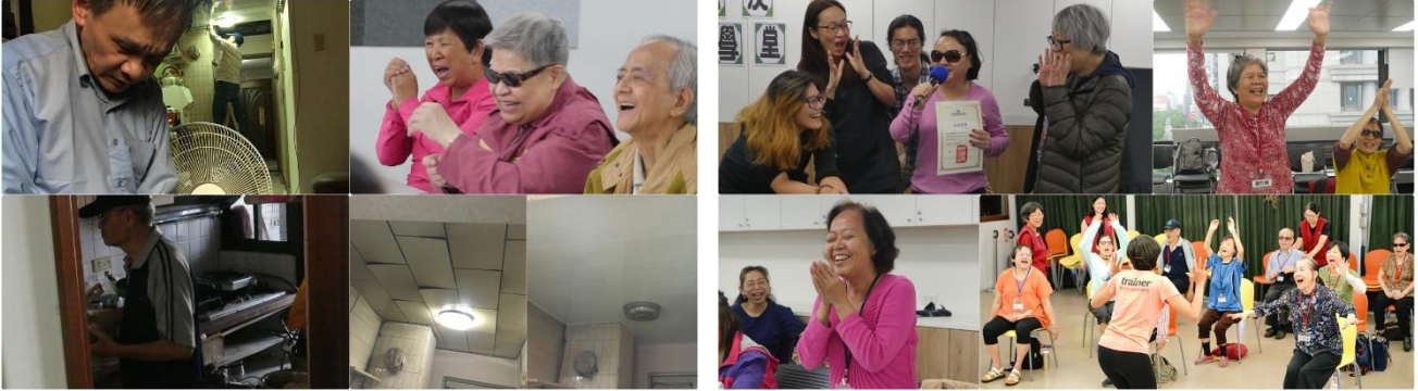
改善居家環境安全讓視障獨居長輩住得安心

5、辦理 2 場次社區資源聯繫會議，8 個單位出席，進行視障獨居長者服務宣導及交換服務訊息，整合視障獨居長者的服務資源輸送。