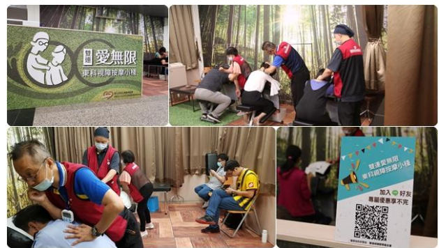
按摩小站與企業進用協助按摩師穩定就業