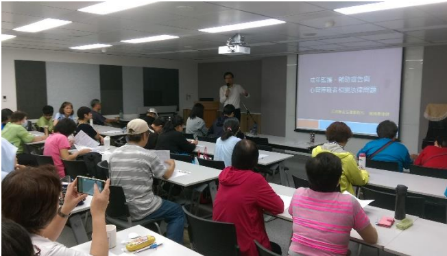
臨托托服務在職訓連增進服務知能