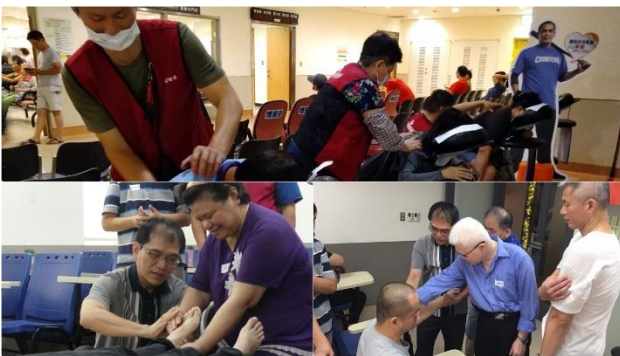
視障按摩在職訓練與推廣

辦理「按摩師服務品質提升」在職訓練課程30小時，包含講師授課以及實際參訪，共服務 115 人次。